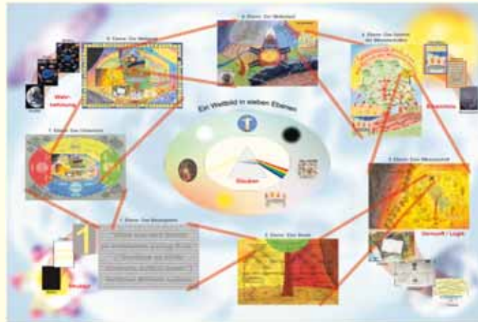
vom Allgemeinen ...

Das Weltbild in sieben Ebenen ist eine Interpretation des Verses: „Alles aus dem Nichts zu entwickeln genügt Eins.“ von Gottfried Wilhelm Leibniz. Erkenntnis soll dabei zugleich der Wiedergutmachung für die Vertreibung aus dem Paradies dienen, um das Potenzial für eine bessere Welt zu heben.