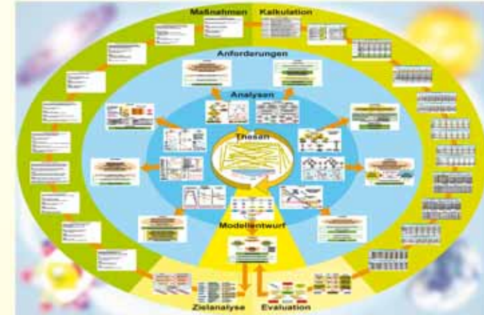
... zum Speziellen

Die nur scheinbar der Empirie widersprechenden Analysen beweisen die absurd klingende These, dass wir weniger arbeiten, mehr verdienen und sozial abgesichert sein müssen.